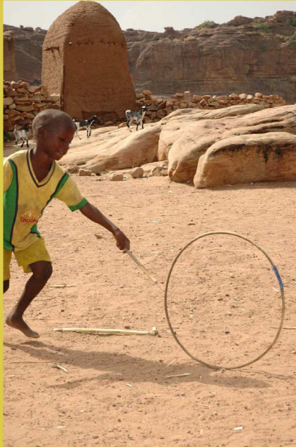
Hindernisrennen mit Reifen machen Spaß