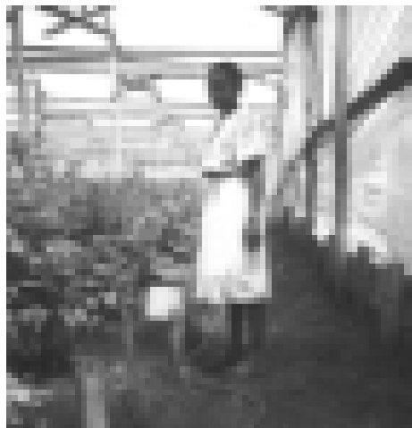
Arbeiterin auf einer Blumenfarm in Tansania; Foto: FIAN