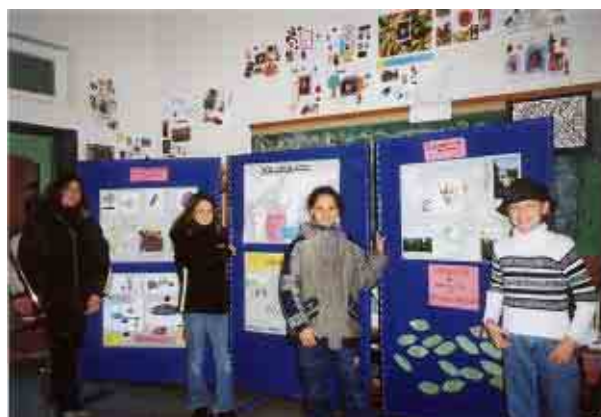
Schülerinnen und Schüler der Albert-Schweitzer-Schule präsentieren die Ergebnisse ihres Unterrichtsprojektes „Kakao und Schokolade“.