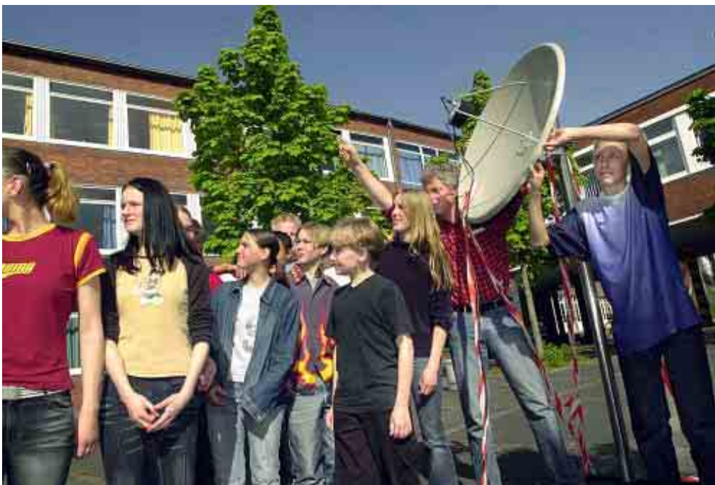
An der Realschule Heessen

Darüber hinaus richtet S-N-O-W einen sogenannten „matching fund“ ein. Dabei wird jeder von den Schülerinnen und Schülern eingeworbene Euro, der für das Gemeinschaftsprojekt bestimmt ist, durch Firmen und Stiftungen verdoppelt.