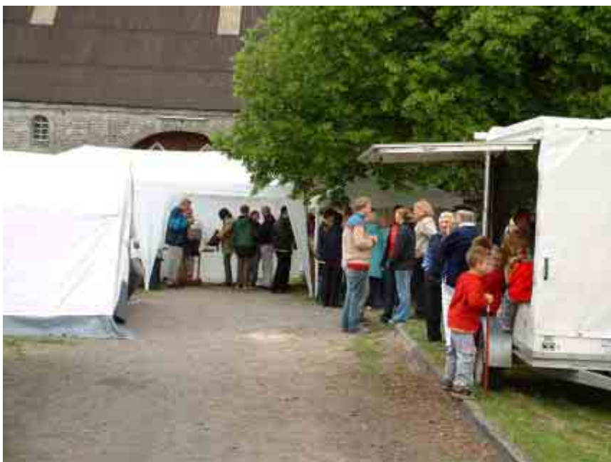
Infoparty im Eilmsers Wald

Neben der Landesgemeinschaft Naturschutz und Umwelt NRW (LNU), vertreten durch die BG Weetfeld, waren auch der NABU-Hamm und der BUND