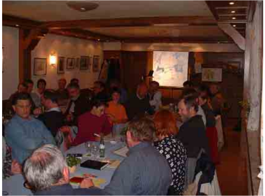
Im Lindenhof am 21. Mai 03

Am 21. Mai hatte der Ortsverband Rhynern von Bündnis'90/Die Grünen