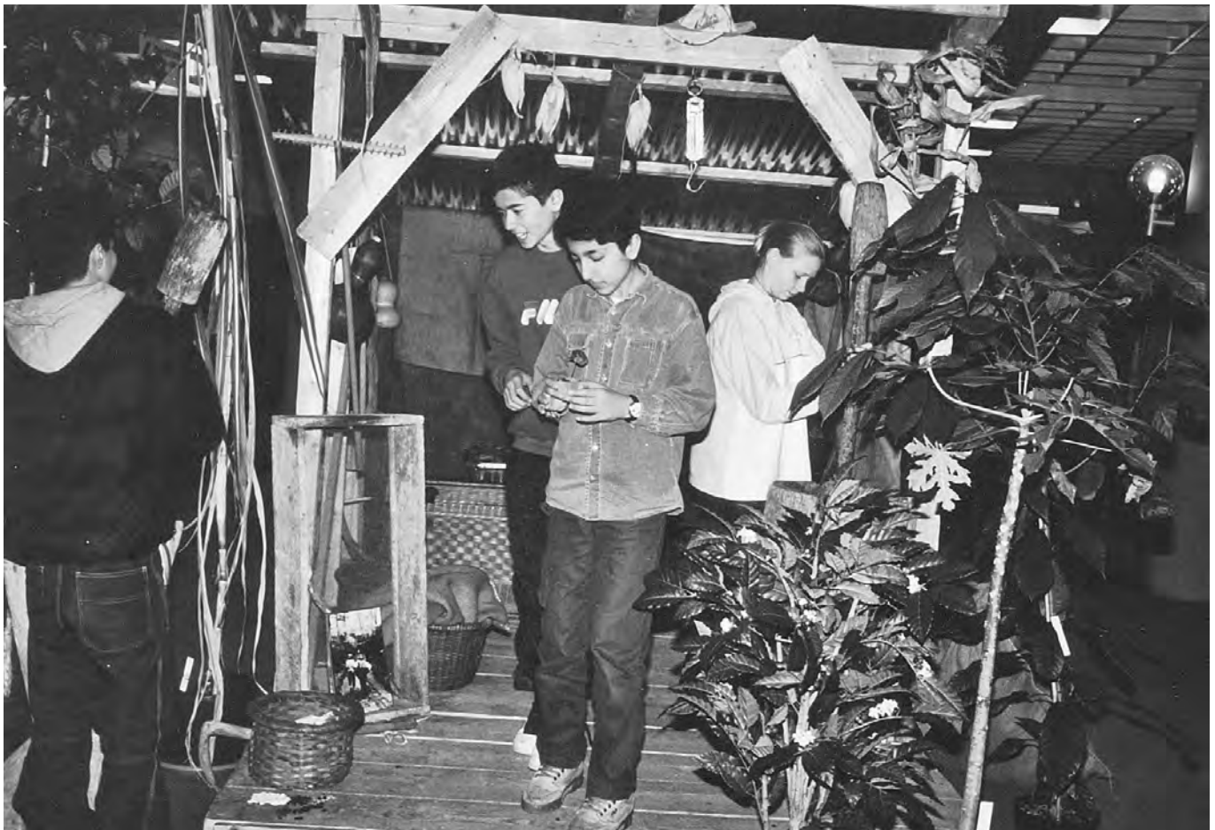
Im Zentrum des Erlebnisraums „Kaffee“ steht die Hütte des Kleinbauern.

Wenn Kinder lernen, tun sie dies in der Regel mit allen Sinnen. Gut konzipierte Ausstellungen berücksichtigen dies und ermöglichen den jungen BesucherInnen, nicht nur die Augen, sondern auch Hände, Nase und Ohren zu benutzen. Das Forum für Umwelt und gerechte Entwicklung präsentiert zurzeit eine Ausstellung für Kinder und Jugendliche, in der die Kinder sich auf eine imaginäre Reise in den tropischen Regenwald Costa Ricas aufmachen und dabei durch lebensnahe Aktionen eingebunden werden.