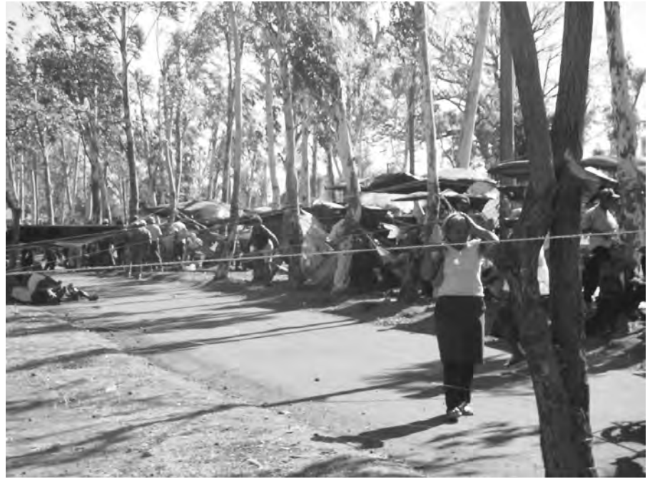
Das „Camp der Opfer“

Saludos cordiales, amistosos y solidarios de Nicaragua!!! Managua 21. Februar 2004