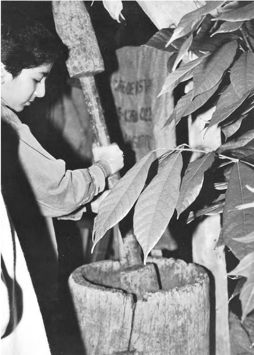
Ein Kaffee-Kleinbauer auf Zeit trennt im Mörser die Bohnen vom Fruchtfleisch der Kaffeekirschen.

lichen Lebens- und Arbeitsbedingungen der Menschen in Costa Rica kennen. Sie können dabei selbst aktiv werden, in die Rollen der Menschen dort schlüpfen und Produktionsprozesse nachempfinden.