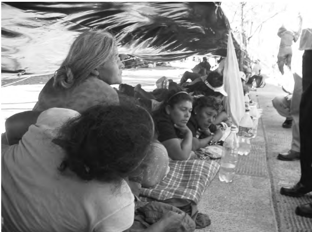
Die „Wache der hungernden Frauen“

Nach fast sieben Wochen vor dem nicaraguanischen Parlament und einem Hungerstreik von 250 Arbeitern hat die Regierung Bolaños ein Abkommen mit den protestierenden Arbeitern ausgehandelt. Darin verpflichtet sich die Regierung u.a. dazu, die Arbeiter juristisch im Kampf gegen die amerikanischen Konzerne zu unterstützen. Die Menschen mit den schwerwiegendsten gesundheitlichen