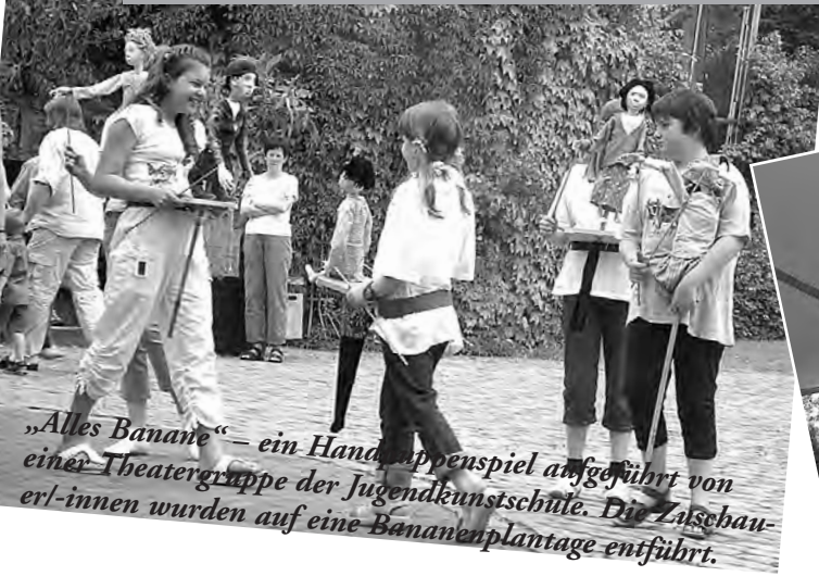
„Alles Banane“ – ein Handpuppenspiel aufgeführt von einer Theatergruppe der Jugendkunstschule. Die Zuschauer-erl-innen wurden auf eine Bananenplantage entführt.