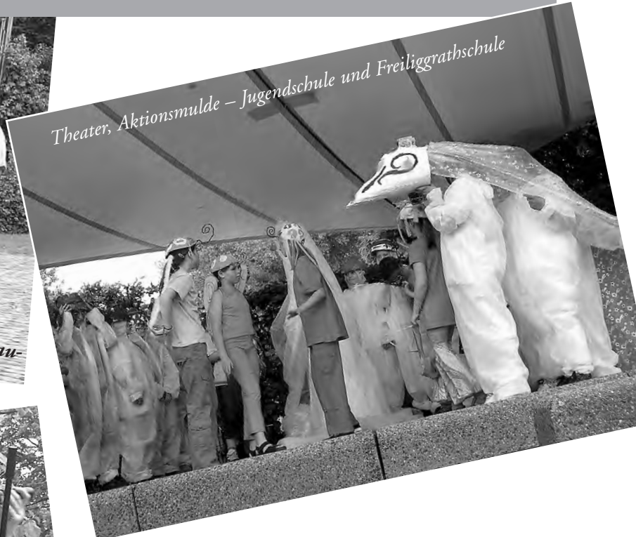
Theater, Aktionsmulde – Jugendschule und Freiligrathschule