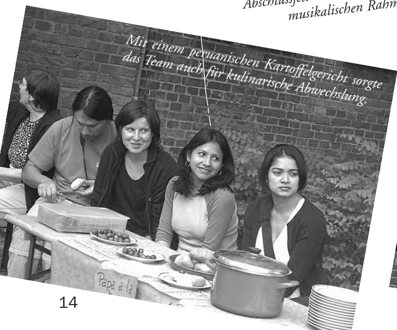
Mit einem peruanischen Kartoffelgericht sorgte das Team auch für kulinarische Abwechslung.