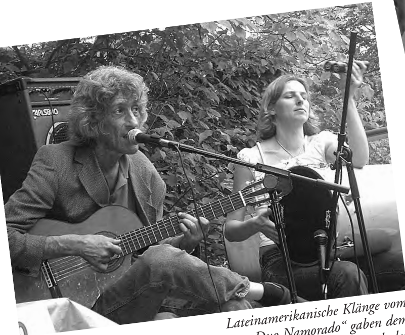
Lateinamerikanische Klänge vom „Duo Namorado“ gaben dem Abschlussfest im Maxipark den musikalischen Rahmen