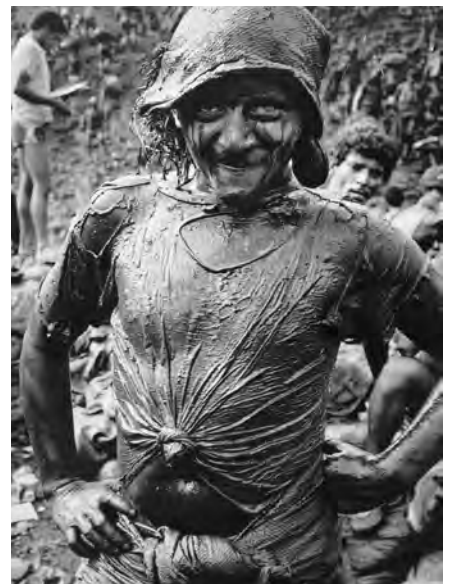
Bei der „Goldsuche“ im Hammer Maximilianpark ging es manierlicher zu.

Es entstand die größte, gewalttätigste und chaotischste Goldmine der Welt.