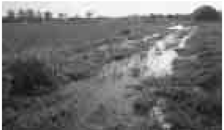
1955 bereits im Gründungsprotokoll angekündigt, aber erst 2003 verwirklicht: Erwerb einer Wiesenfläche in Hamm-Haaren für einen umfassenden Naturschutz.

1986 begann beim NABU die Phase der Kindergruppenarbeit. Es sprach sich schnell herum, dass ein interessantes Programm geboten wurde. Ein großer Teil der Gruppenstunden wurde in