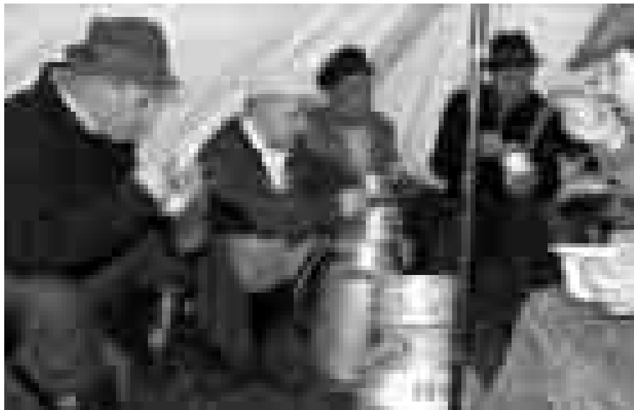
Zeltlager um 1960: Eine „äußerst rustikal angehauchte Männergesellschaft“ stärkt sich für eine Exkursion im Bentheimer Moor.

50 Jahre Vereinsgeschichte – diese Zeitspanne ist voll gespickt mit Ereignissen, mit schönen Erlebnissen, mit