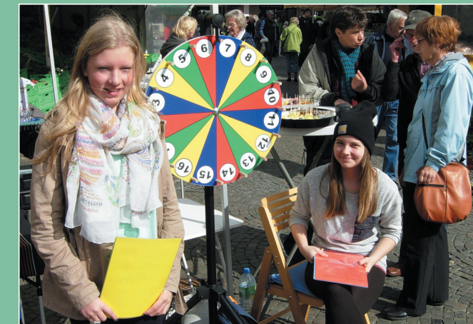
Das FUGe-Team auf dem Markt an der Pauluskirche Hamm

Zum Weltladentag stellt FUGe viele positive Beispiele von regionaler Vermarktung und Fairem Handel vor.