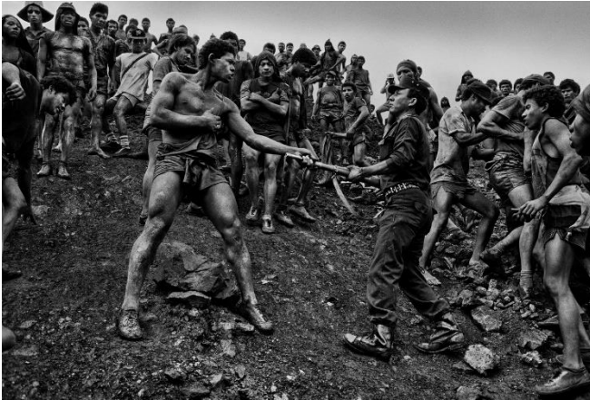
Goldrausch: Serra Pelada, Brasilien