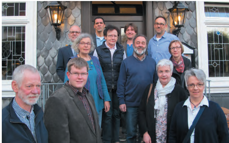
Mitglieder von Steuerungsgruppen der Fairtrade-Towns aus der Hellwegregionen „Was bringt der Faire Handel“ am 20. April 2016 in Erwitte

das Engagement von Kindertagesstätten im Bereich des Fairen Handels und zahlreiche spannende Veranstaltungen in Lünen. Zum Beispiel die Vorführung des Musicals Global Playerz im März 2016 im Lükaz (Lüner Kultur- und Aktionszentrum). Erwähnenswert ist die Entwicklung der Fairtrade-Town-Bewegung in Schwerte, die sich auf die Schulen positiv auswirkt. Anfang 2015 wurde die Gesamtschule Schwerte Fairtrade-School. Es gibt in der Schule Aktionen zu fairen Rosen, und das Schülercafé wurde um ein Fairtrade-Sortiment bereichert.