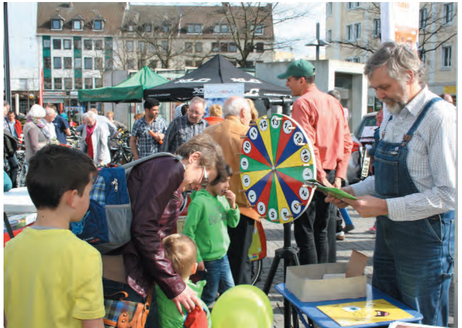
Glücksrad mit Fragen zu FUGe und Klimaschutz.

Eine Menge Fachwissen mussten die Besucher beim Quiz des European Energy Award-Teams (eea) der Stadt mitbringen. Dafür gab es