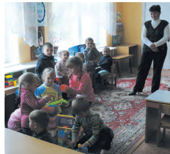
Besuch im Kindergarten von Gorotschitschi 2012.