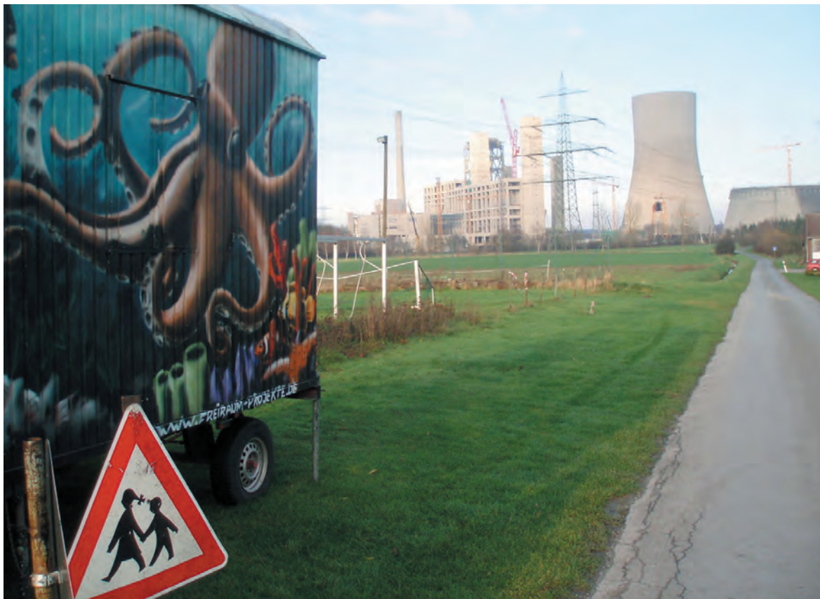
Blick auf die Arme einer Riesenkrake; im Hintergrund das Kohlekraftwerk Hamm-Uentrop.

bis viermal preiswerter, mehrere Millionen Tonnen Steinkohle 10.000 km mit Schiffen über den Atlantik zu fahren.