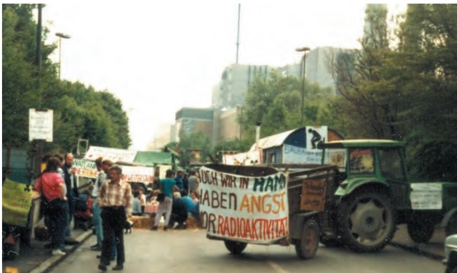
Blockade am THTR, 1986.

Der Bau des Druckwasserreaktors wurde aus finanziellen Gründen aufgegeben, die Inbetriebnahme des THTR rückte jedoch immer näher. Während einer mehrjährigen Kampagne sammelten wir 100.000 Mark, um gegen insgesamt 17 Teilerrichtungsgenehmigungen zu klagen. Wir erstritten einen gerichtlich angeordneten sechswöchigen Baustop, viele Ungereimtheiten traten zutage und die Probleme beim THTR wurden verstärkt wahrgenommen. Es war also wichtig, auch diesen Weg zu gehen.