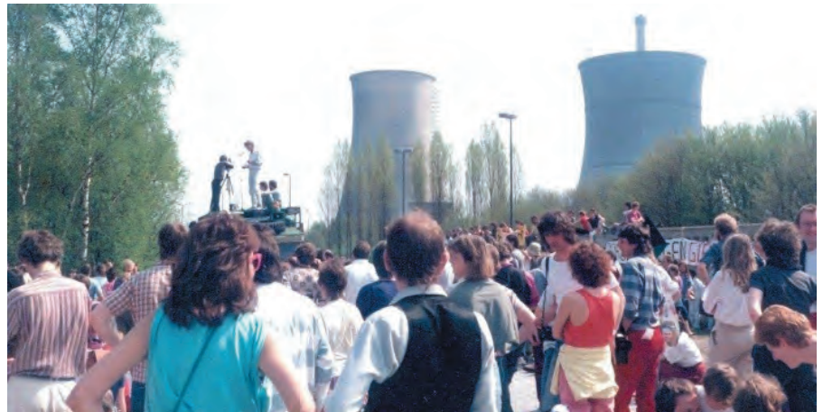
Kundgebung am Bauzaun, 1986.

Es war erschreckend, wie wenig Einfluss wir als einfache Bürger auf den Gang der Ereignisse bei einer so gefährlichen Technologie, wie der Atomkraft, nehmen konnten. Bürgerinitiativen waren damals ein völlig neues Phänomen in Deutschland und stießen auf heftige Ablehnung bei der Exekutive und bei fast allen maßgeblichen Mandatsträgern der Parteien, die oftmals über lukrative Aufsichtsratsposten Zuwendungen von den Vereinigten Elektrizitätswerken (VEW) erhielten. In den Medien fand fast ausschließlich Hofberichterstattung für die Energiekonzerne statt. Kritisches Informationsmaterial zum Thema Atomkraft gab es 1976 bis auf ein einziges Buch und ein paar vereinzelte Flugblätter nicht.