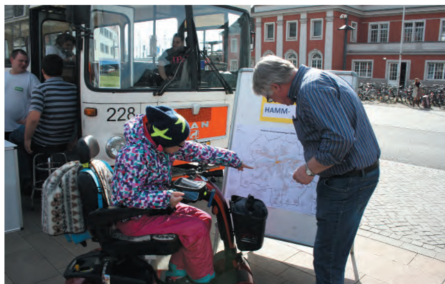
Der Bürgerbusverein informierte über sein Vorhaben.

am Ende aber auch hochwertige Gewinne für die erfolgreichen Teilnehmer. Aber auch beim NABU und „Wir helfen in Ukunda“ konnten die Besucher eine Menge über Umwelt- und Klimaschutzprojekte erfahren.