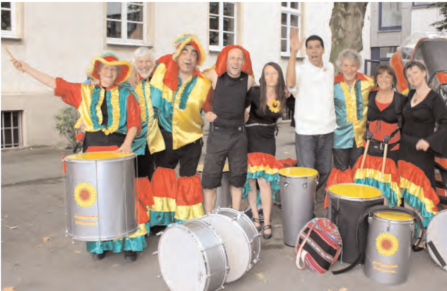
Weltmusik mit Sambanda Girassol, 2014.