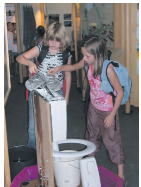
Wasser-Welt-Ausstellung in der Elektrozentrale des Maxiparks 2006.