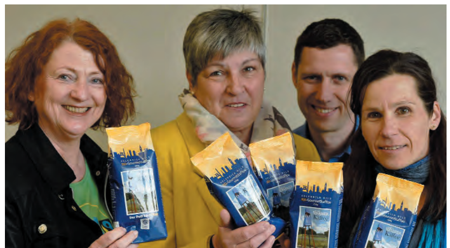
Steuerungsgruppe der Fairtrade-Town-Kampagne Bergkamen stellen den Bergkamen-Bio-Kaffee vor.