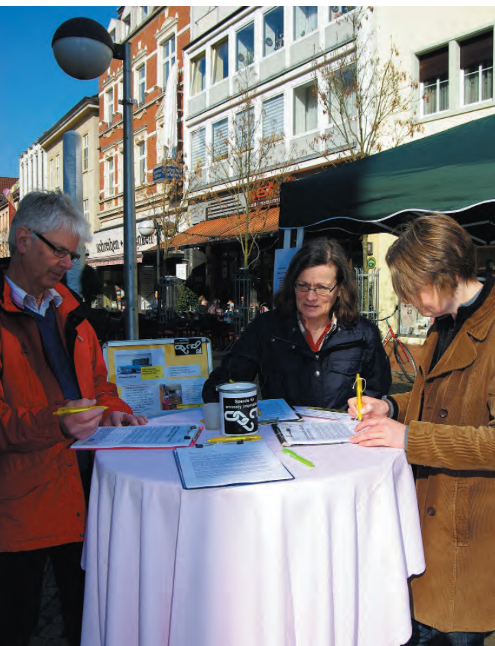
Unterschriften wurden auch in der Hammer Fußgängerzone gesammelt