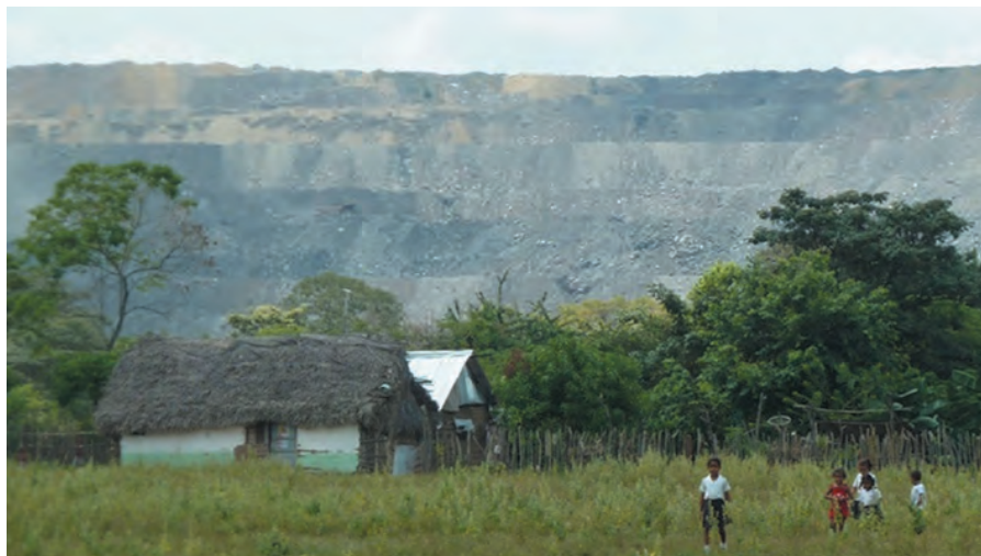
Kohleabbau vor der Haustür im Dorf El Hatillo in der Region „El Cerrejón“, Kolumbien.

In Schulworkshops setzen sich Teilnehmer/-innen mit den möglichen Wegen zu einem nachhaltigen Energieverbrauch auseinander. In den offenen Foren wird über die Folgen von Atomkraft, Erdgas-Fracking, Braun- und Steinkohle-Tagebau in Deutschland oder Kolumbien kontrovers diskutiert. Bei der Vorführung des Films „La Buena Vida“ von Jens Schanze, geht es u. a. um die Zerstörung mehrerer Gemeinden der Wayúu in der Kohleabbauregion „El Cerrejón“ in Kolumbien.