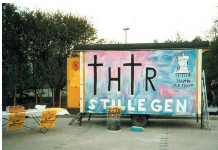
Rechtsschutzaktie zur Finanzierung der Prozesse, Der Blockade-Bauwagen auf der THTR-Zufahrt, 1986. 1980.