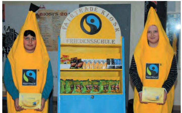
Ein eigener Fairtrade-Kiosk von Schülern für Schüler.

von Schülern der Jahrgänge 8-13 sowie dem Kollegium rund 600 Rosen beim Fairtrade-School-Team vorbestellt, die dann – selbstverständlich anonym – an die entsprechenden Personen verteilt wurden. Dabei erhielt manch einer durchaus mehr als nur eine Rose und durfte rätseln, wem er denn wohl so am Herzen liegt.