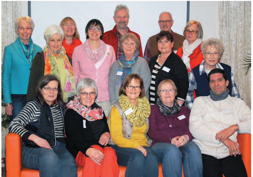
„Familientreffen“ der Weltläden.

Nachdem das erste Vernetzungstreffen der Weltläden in der Region 2014 bei so vielen Teilnehmern in bester Erinnerung war hatte sich FUGe bereiterklärt, das zweite Treffen auszurichten. Und wie so häufig, was lange währt wird am Ende gut. Mit 19 Teilnehmern war das Treffen im Café Komma am 20. Februar 2016 sehr gut besucht. Mitarbeiter und Mitarbeiterinnen aus den Weltläden in Hamm, St. Regina (Hamm), Unna, Ahlen und Werne waren gekommen, um sich über die Möglichkeiten und Probleme der Weltläden auszutauschen.