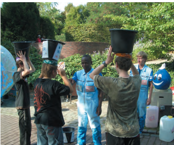
EWU-Tag-Aktion von ART AT WORK 2006.

Als Wunsch möchte FUGe für die Zukunft anregen, dass sich wieder mehr professionelle Unternehmen aus dem Eine-Welt- und Umweltbereich wie zu Anfang an dem EWU-Tag beteiligen. Wünschenswert wäre auch eine breitere Planungsgruppe von Teilnehmern gemeinsam mit FUGe, damit eine Vielfalt von Ideen und auch Neues und Ungewohntes gewagt wird.