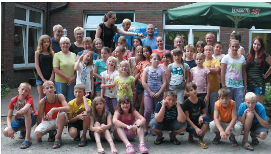
Internationale Begegnung der Naturfreunde-Kindergruppe Hamm-Werries und den Kindern aus Gorotschitschi 2013 im Naturfreunde-Haus Ebberg in Schwerte-Westhofen.

Tschernobyl ist heute und bleibt in ferner Zukunft eine Todeszone.