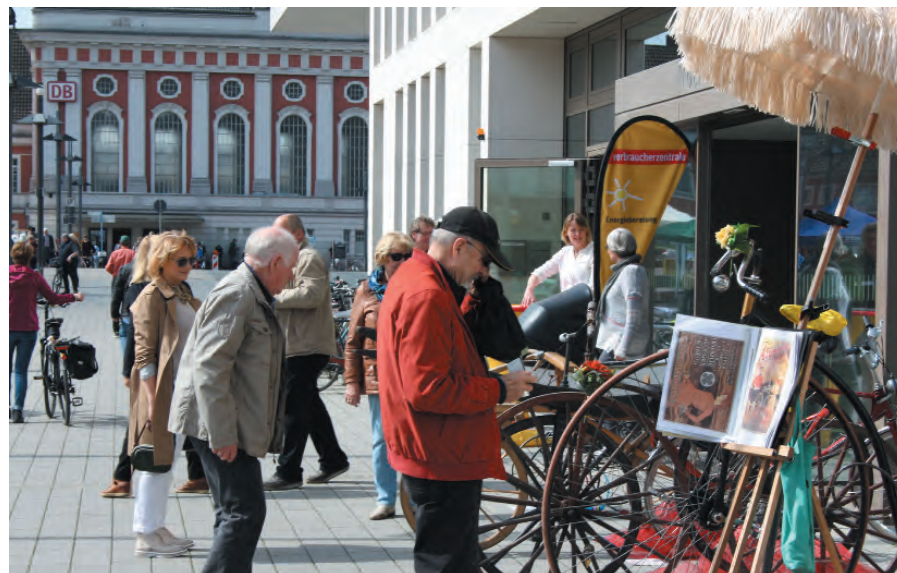
Historische Räder und Verbraucherzentrale Seite an Seite.