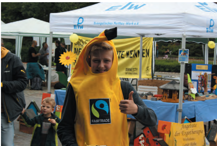
Auch Schüler setzten sich bei der Veranstaltung für den Fairen Handel ein.