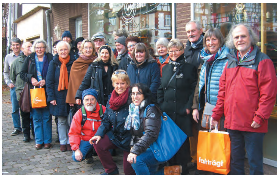
Der Ökumenische Initiativkreis Lippstadt freut sich auf das 35jährige Bestehen des Weltladens.

Warstein und Welper wollen sich für den Titel Fairtrade-Town 2016 bewerben.