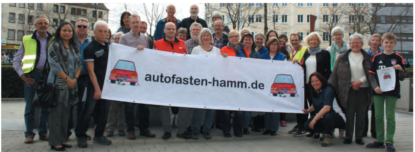
Teilnehmer der Aktion Autofasten.

Knapp 15 Tonnen weniger CO 2 -Emissionen in Hamm und eine klimafreundliche Energie für die Philippinen – dank der engagierten Teilnahme am Autofasten wird so das Klima gleich doppelt geschont. Und so steht bereits fest: Auch 2017 wird das Autofasten wiederholt.