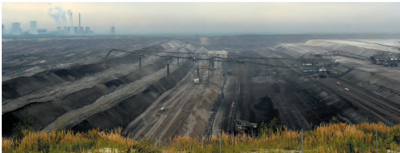
Blick in den Tagebau Nochten und im Hintergrund die Kohlekraftwerk Boxberg, Lausitz.

Im Jahr 2018 werden die letzten Zechen in Deutschland geschlossen. Deutsche Kohle ist aufgrund niedriger Weltmarktpreise nicht länger rentabel genug. Es ist drei-