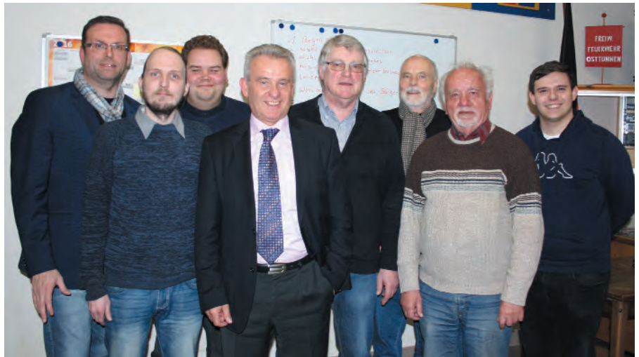
Der erste Vorstand des neuen Vereins.

Die südlichen Außenbezirke der Stadt Hamm sind per ÖPNV kaum bis gar nicht zu erreichen. Die Menschen dort sind, wie bereits beschrieben, immer auf ihre eige-