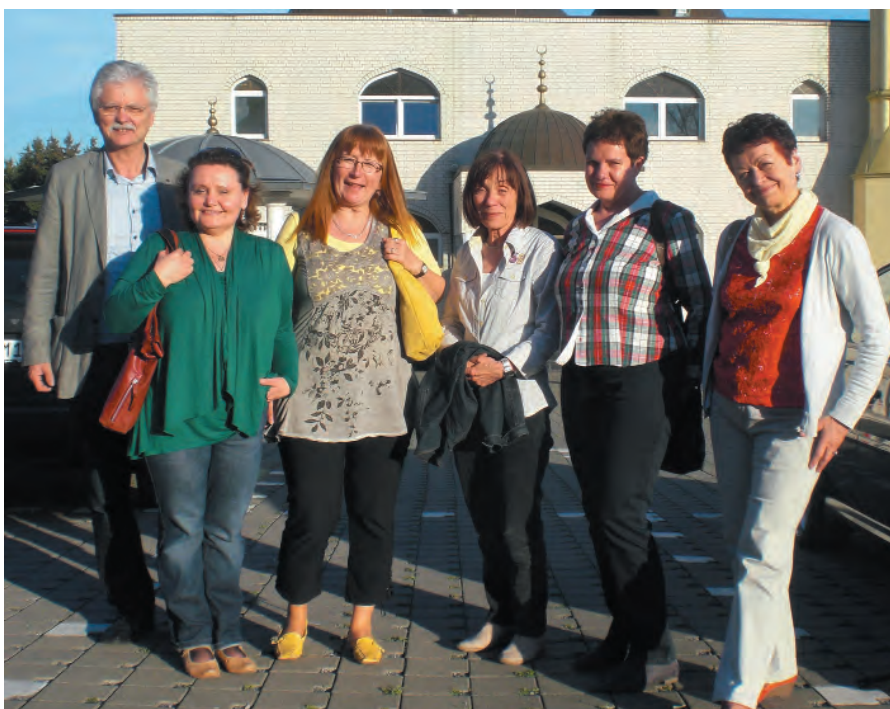
Besuch aus Kalisz an der Yunus-Emre-Moschee.

Mit fast 400 Mitgliedern zählt der Internationale Club zu den größten Vereinen der Stadt. Er setzt sich nach Kräften dafür ein, Freundschaft über Grenzen hinweg zu knüpfen und zu pflegen.