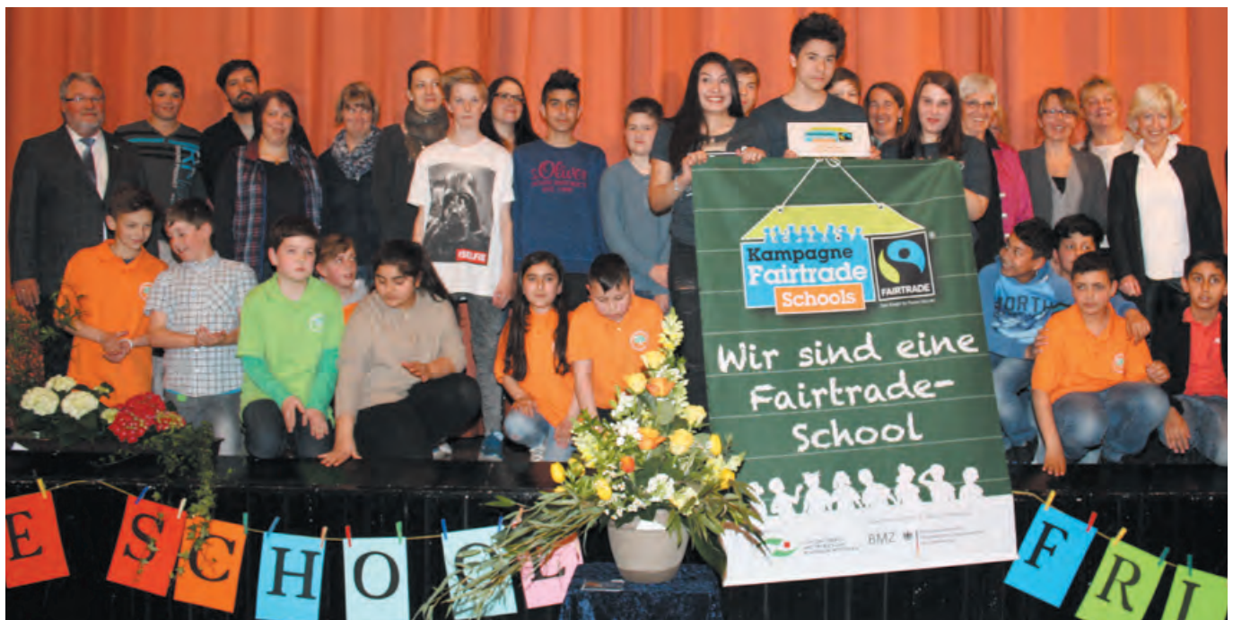
Großer Festakt zur Verleihung des Titels Fairtrade-School.