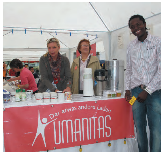
Humanitas sorgt für „faire Kaffeepausen“.