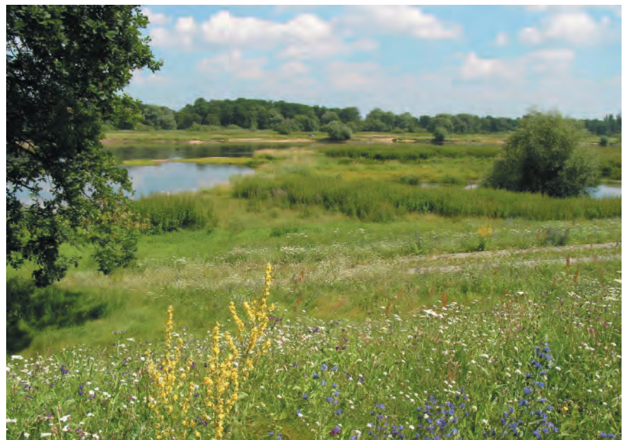
Erfolgreiches Gemeinschaftsprojekt: Die Renaturierung der Auen

der Stadt Hamm seit vielen Jahren eng und vertrauensvoll mit vier Biologischen Stationen im Umkreis zusammen. Die erfolgreichen Life-Projekte in den östlichen Lippeauen sind ein eindrucksvolles Beispiel dafür. Und da wir als große Koalition für die Renaturierung der Lippeauen noch viel mehr vorhaben, freue ich mich jetzt schon auf das Wirken der Bio-Station Hamm.