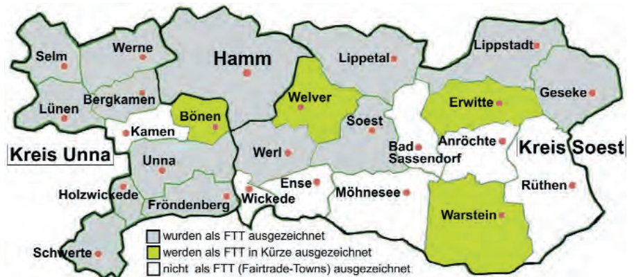
Fairtrade-Towns-Kampagne (FTT) in der Hellwegregion (Stand Mai 2016)

Mit der Herausgabe der Fairtrade-Aufkleber Ende 2015, der die an der Kampagne beteiligten Vereine, Schulen, Handelsgeschäfte und Gastronomen besser erkennbar macht, war die Kampagne in Hamm vor allem durch das FUGE-Projekt „Fairen Handel in die Mitte bringen“ gut präsent. Die vielen Aktionen des Weltladen-Treffs, das Programm rund um Kuba im Rahmen des Weltgebetstags der Frau-