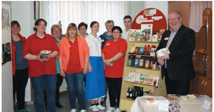
Der faire Kiosk wurde vorgestellt.

Die Woche vor dem Misereor-Sonntag stand im Caritas-Seniorenzentrum St. Bonifatius unter dem Motto des Fairen Handels. Durch eine Ausstellung im Café des Hauses wurden Bewohner, Mitarbeiter und Gäste über den Fairen Handel informiert. Donnerstags organisierten die Auszubildenden der Hauswirtschaft ein „faires Frühstück“ für die Mitarbeiter des Hauses. Neben „fairem“ Kaffee, Tee und Schokolade konnten auf selbstgebackenem Brot verschiedene Aufstriche probiert werden. Bei einem Quiz über Schokolade und Kaffee testeten die Mitarbeiter ihr Wissen und hatten die Möglichkeit, auch etwas zu gewinnen. Eine kleine Auswahl der Produkte aus dem Weltladen kann seitdem auch im Seniorenzentrum St. Bonifatius gekauft werden. Die