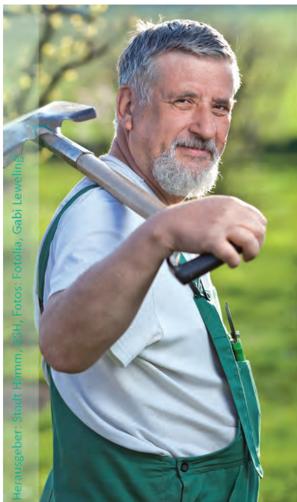
Herausgeber: Stadt Hamm, ASH, Fotos: Fotolia, Gabi Leweling

Beratungstermine sind selbstverständlich nach vorheriger Absprache auch außerhalb der Öffnungszeiten möglich.