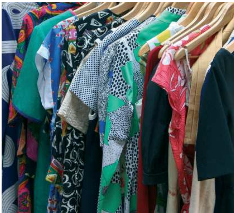
Voller Schrank – und doch nichts zum Anziehen?