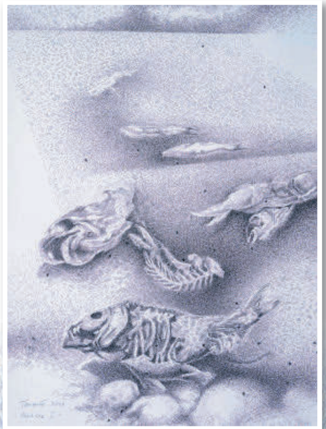
„Aralsee 1“, Federzeichnung auf Karton von Peter Tournée.