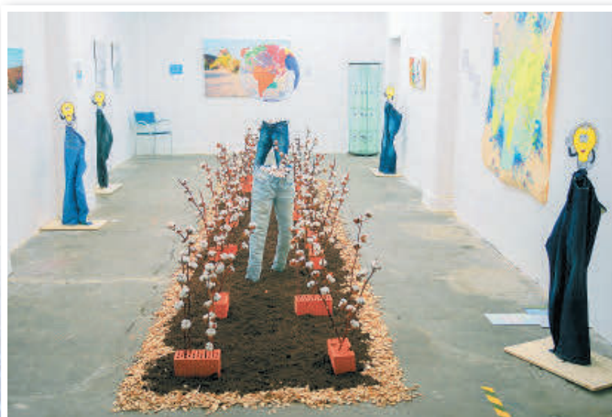
„Die bizarre Mitwelt einer Jeans“. Installation von Grazyna Maniecka und Robert Szkudlarek.

Und vielleicht ist es noch nicht ganz vorbei mit der reisenden Jeans. Vielleicht, sagte Kasten zur Finissage der Ausstellung, gebe es ja die Möglichkeit, in die Schulen zu gehen, sofern Platz genug vorhanden ist – wenn es die Inzidenzen in der zweiten Jahreshälfte zulassen.