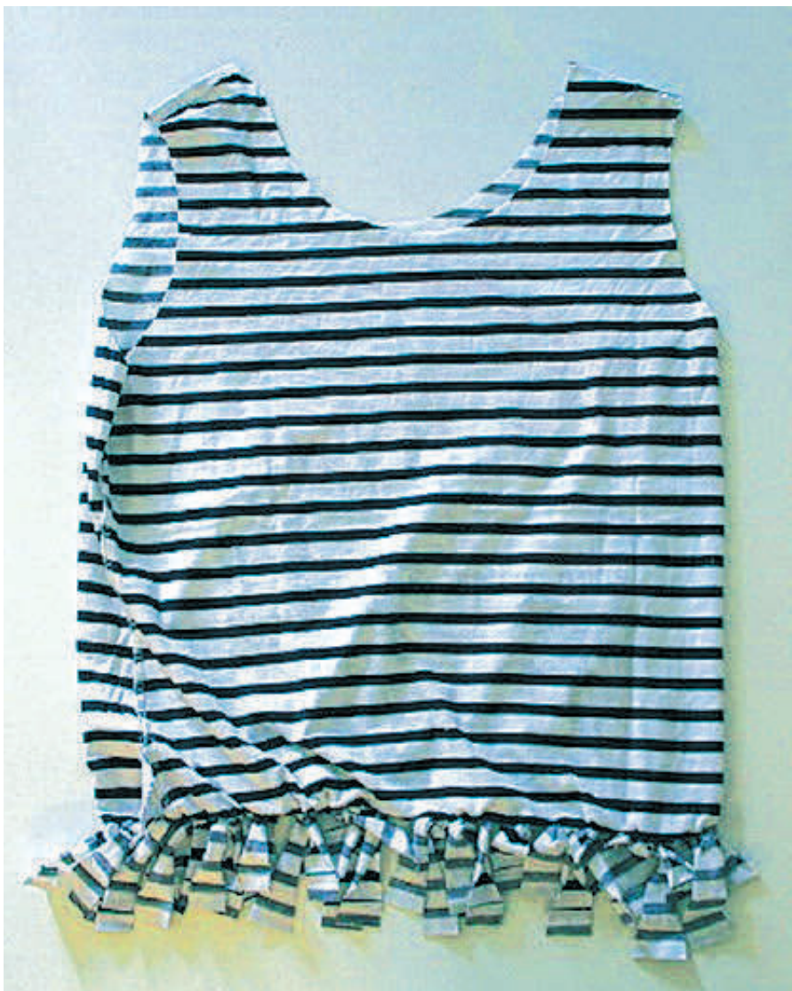
Auf den ersten Blick ein T-Shirt – auf den zweiten Blick eine Tasche.