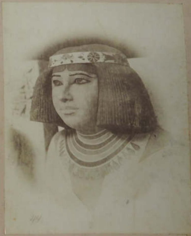
444 Kopf der weiblichen Meridion - Statue (J. Sponson)

(Ich bin die Kabinetsrat von Melchior Sponson Sachverständiger in Paris. Die Kopie wird für den Kaiserlichen Hof [Lithographie] durch Joseph Sponson] und die Abbildung aller die für den Melchior (in dem Buch) die Lithographie der Kopie der Statue