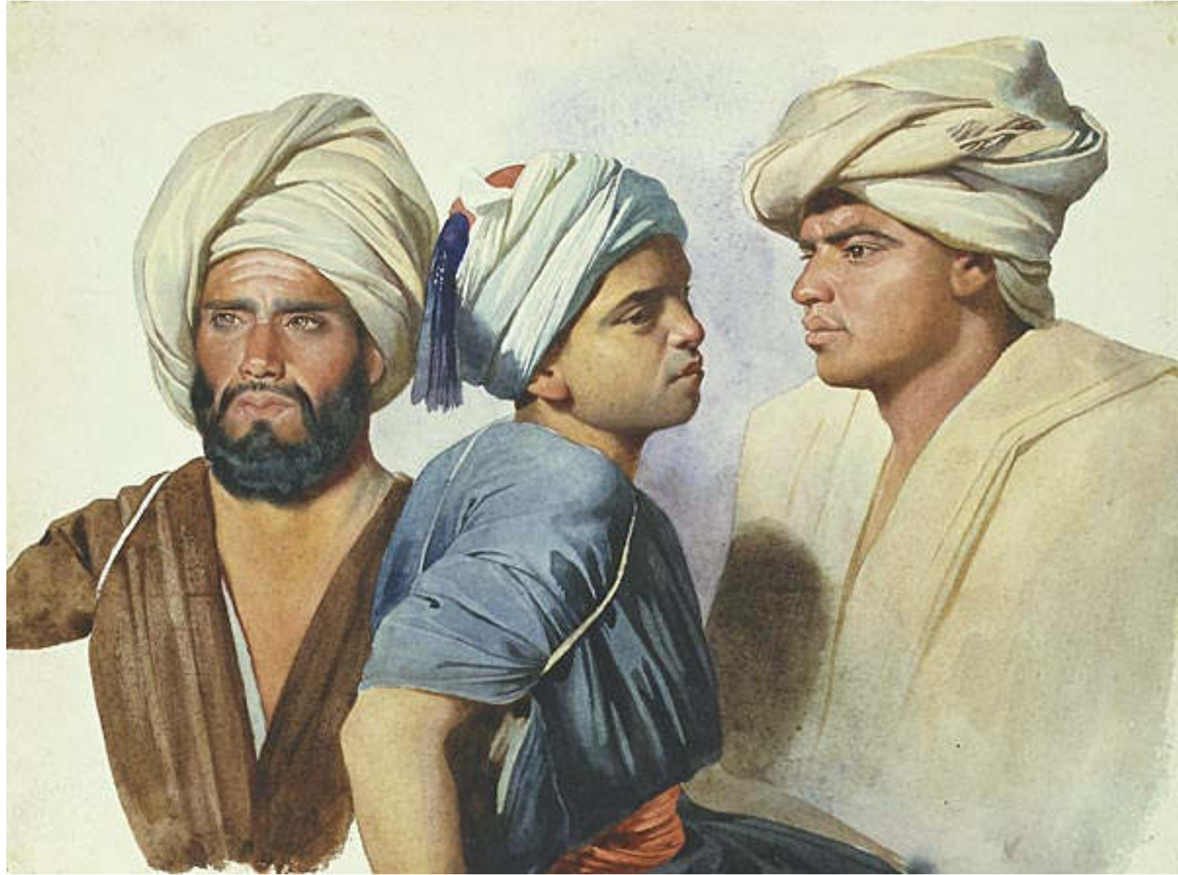
Charles Gleyre , Drei Fellachen