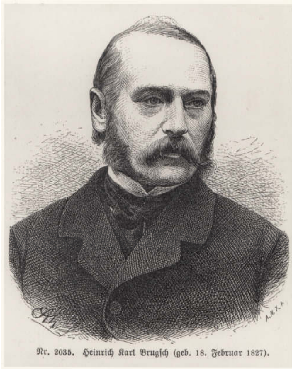
Nr. 2035. Heinrich Karl Brugsch (geb. 18. Februar 1827).