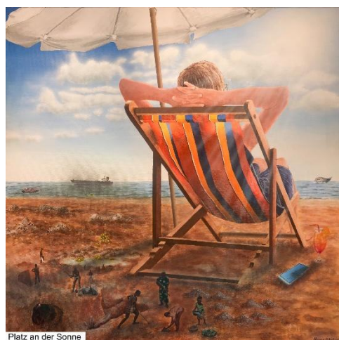
Platz an der Sonne